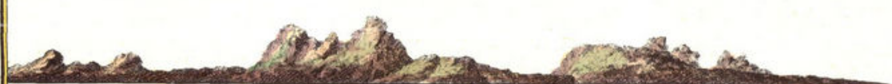
Bus vertoont BON AIRE als den Berg met de Saal 2. Mylen West van u is.

Neta jõe men aan BON AIRE wil weegien: jõe moet men bezuden 't Eyland omloopen, en dan kan men de Plaets bezien: daer de Duytse Woonen, daar legt 't Soud ey hoep, by een huyt, daer de Prince Vlag afwaegt.